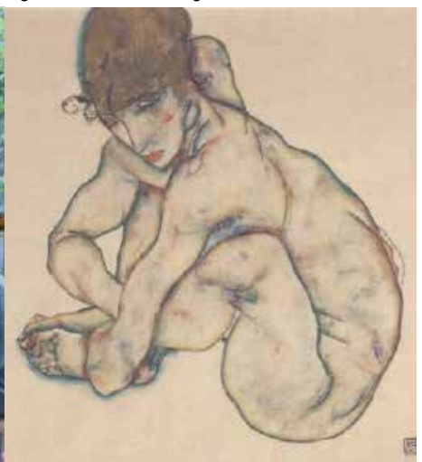
Egon Schiele, Sitting feminine act